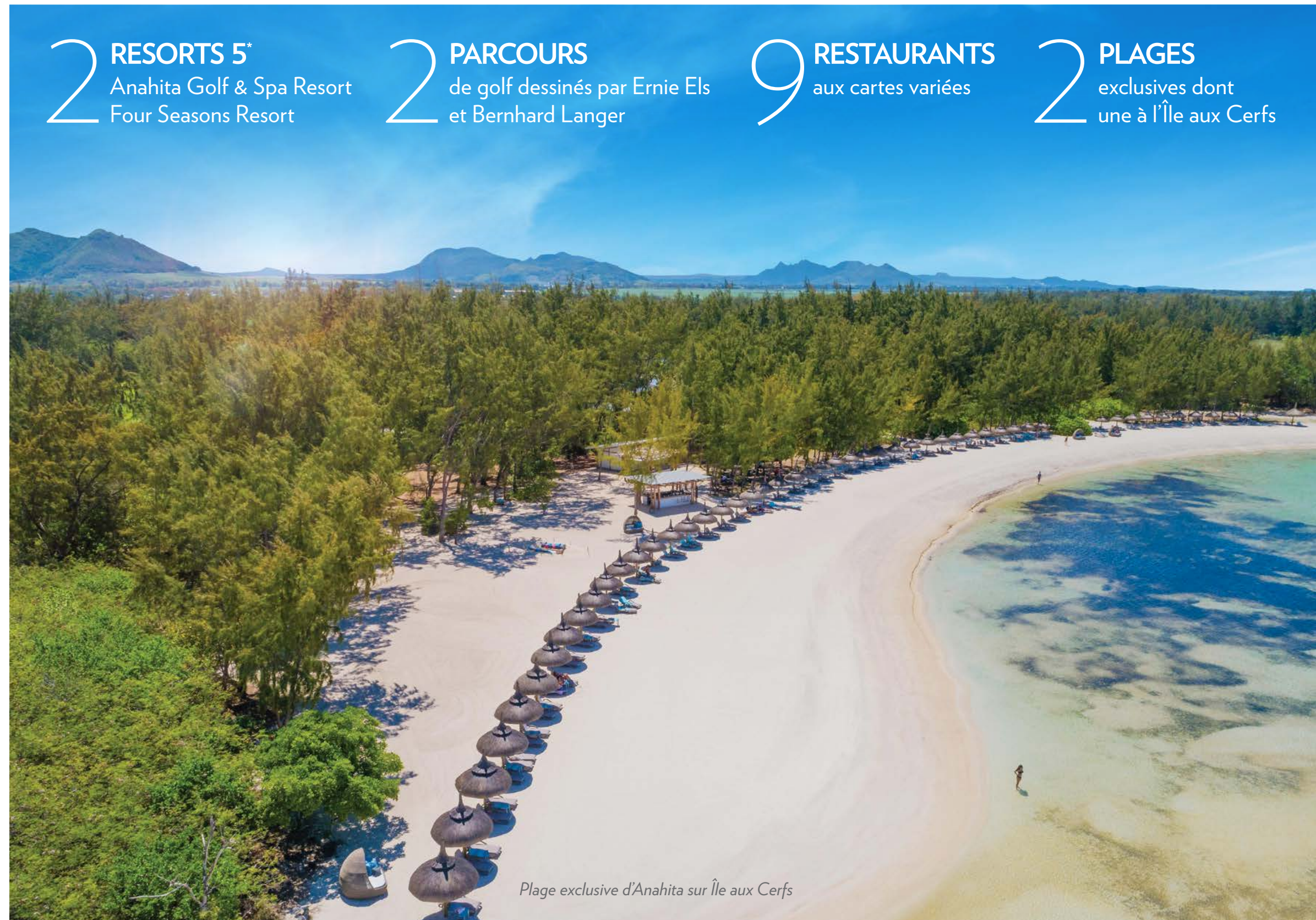
Plage exclusive d'Anahita sur Île aux Cerfs

2 PLAGES exclusives dont une à l'Île aux Cerfs