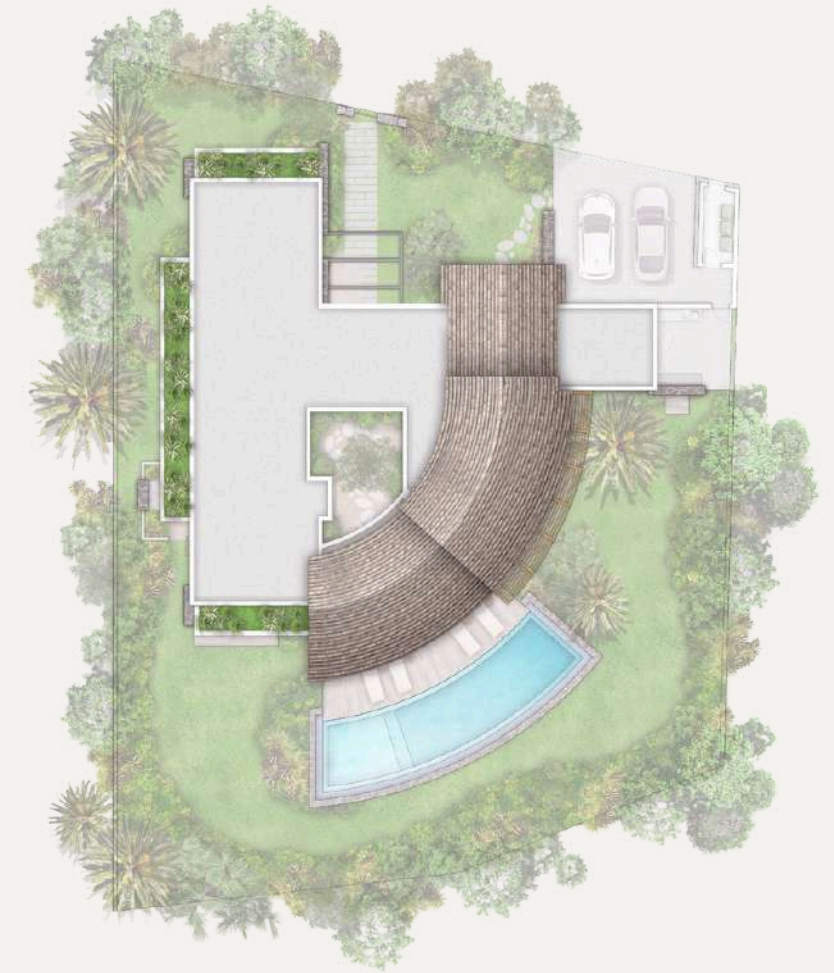
Plan des toitures