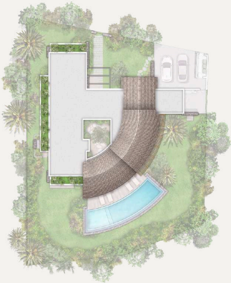
Plan des toitures