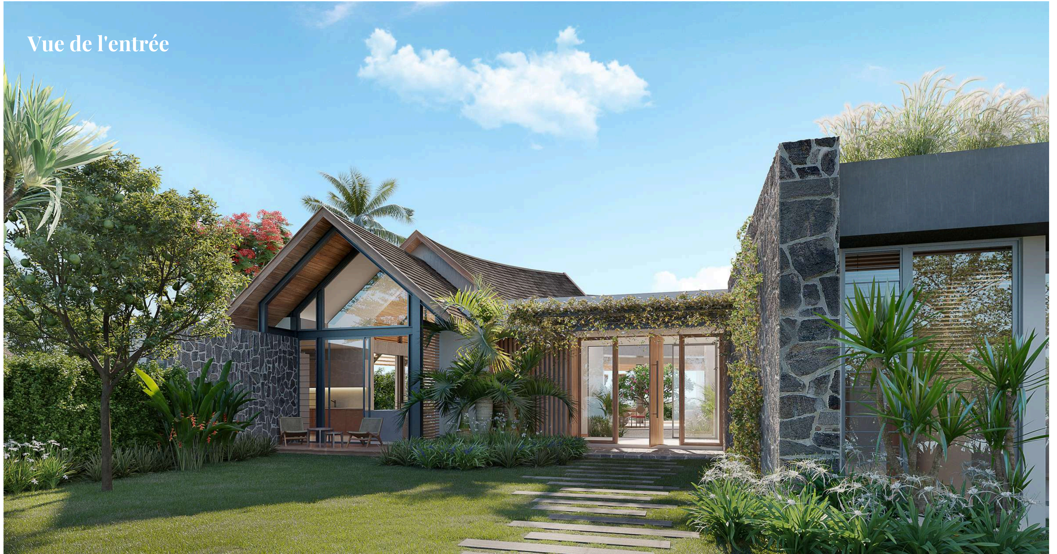
Vue de l'entrée