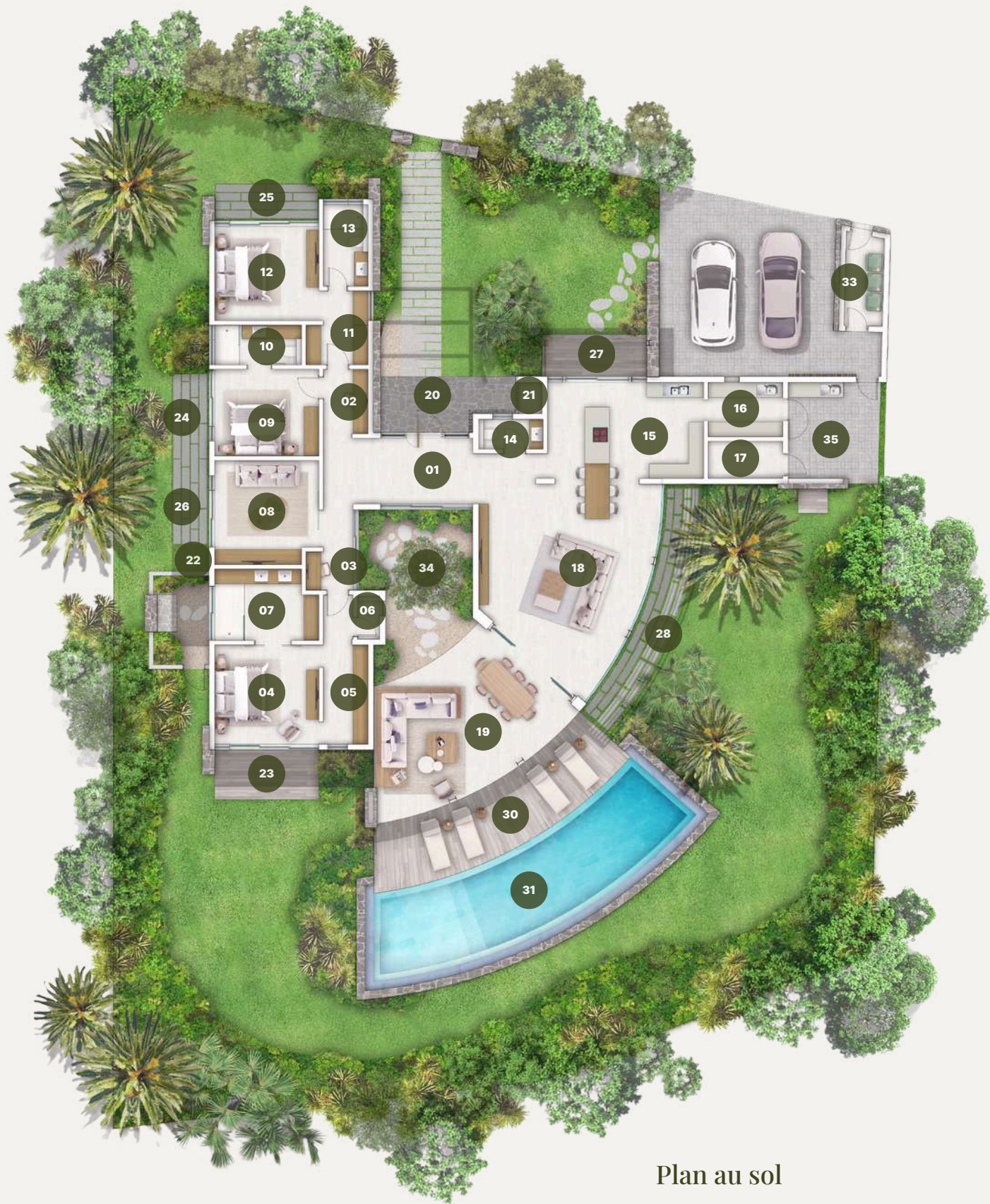
Plan au sol